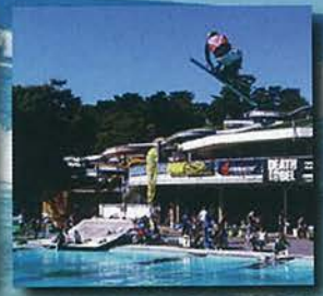
ウォータージャンプ